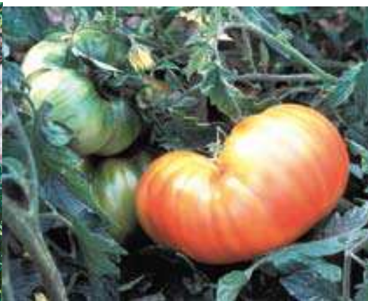
Historische Tomaten Erntereife: spaet

Varietà caratterizzata da frutti molto grossi carnosì con pochi semi, polpa densa sugosa e molto zuccherina , peso medio da 250 a 400 gr. talvolta i frutti raggiungono pezzature enormi anche 1 kg. La polpa al taglio somiglia ad una fetta di ananas ed emana un gradevole profumo. Eccellente in insalata.