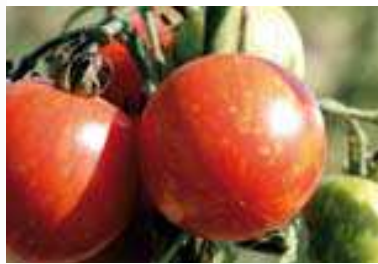
Historische Tomaten Erntereife: frueh

Varietà precoce con piante rustiche e produttive ,frutti da 70 a 100 gr.,con polpa sugosa, dolce di ottima qualità gustativa adatta per insalate e succhi