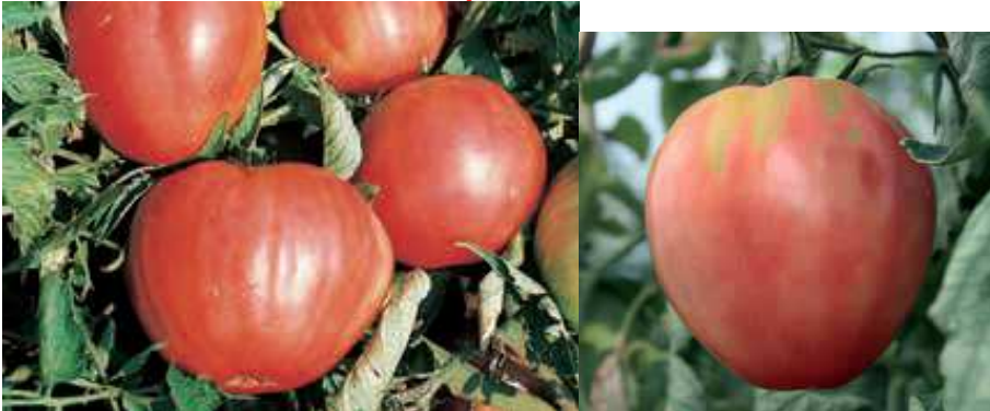
Historische Tomaten Erntereife: spaet

Varietà con pianta indeterminata vigorosa e tardiva (dal vaso 10 al vaso 20). Frutto di colore rosso chiaro dalla caratteristica forma a cuore di grossa pezzatura (250 gr. e oltre) Qualità organolettiche eccezionali (sapore antico) Aromatische Fleischtomate (250 gr). Exzellent fuer sommerliche Salate.