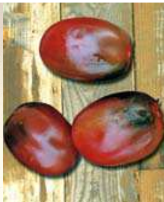
Historische Tomaten Erntereife: mittelfrueh

Varietà con piante rustiche e molto produttive, i frutti portati a grappolo di peso dai 25 – 30 g. di colore vinoso a maturazione , con polpa soda dolce e gustosa, da consumarsi in insalata, conditi all'aceto oppure al naturale con cocktail o aperitivi. Frutti ricchi di antociani (antiossidanti)